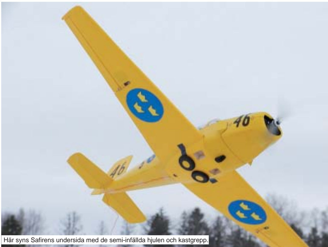
Här syns Safirens undersida med de semi-infällda hjulen och kastgrepp.

När ovansidans plankning skärs till, tänk på att ta till lite extra bredd för att kompensera för ovansidans rundning.